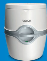
Porta Potti 565

De Porta Potti is een compact en lichtgewicht gesloten sanitair systeem. U kunt dit draagbare toilet bijna overal neerzetten. De Porta Potti wordt veel gebruikt in tenten, vouwwagententen, tenttrailers en op boten. Ze zijn echter ook handig tijdens verbouwingen en geschikt voor zomer- en tuinhuisen. Deze toiletten kunnen in elke ruimte worden geplaatst en zijn geschikt voor mensen van alle leeftijden en ook voor mensen die minder mobiel zijn.